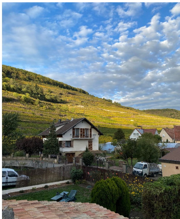
Eggisheim & Kaysersberg