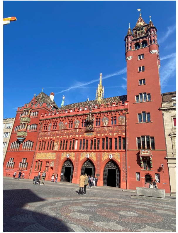
Basel & Straßburg